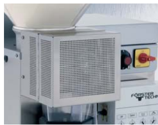
Équipement supplémentaire: grille de protection anti-mouches

La protection anti-mouches aux pores fins destinée au mixer empêche les mouches de s'introduire dans le gobelet mélangeur. Les pores permettent à la vapeur qui se dégage dans le gobelet de s'échapper rapidement, empêchant ainsi la formation d'eau de condensation.