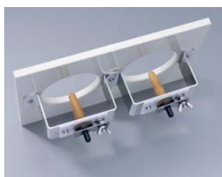
Plaque frontale avec supports de tétine montés aussi séparément

Une station d'allaitement peut alimenter 20 à 30 agneaux et chevreaux. Selon le modèle, vous pouvez faire équiper le distributeur automatique de