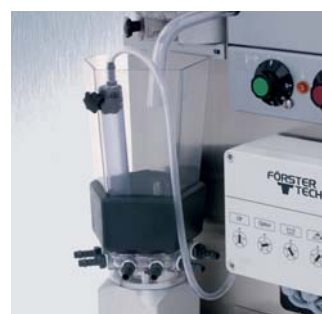
Chauffage du mixer disponible en tant qu'accessoire

De plus, vous pouvez équiper votre distributeur automatique avec un chauffage pour le