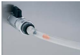
Nettoyage facile des tuyaux

Le mixer ouvert et pivotant, dont le moteur est placé dessous, est d'accès facile, très simple à nettoyer et contrôle à tout moment et en quelques secondes le fonctionnement.