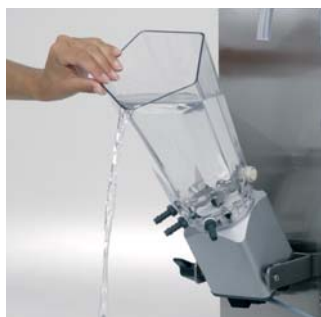
Gobelet mélangeur à accès ouvert

son unité de commande compacte. La commande assure l'exécution de toutes les fonctions sans le moindre incident et a déjà été testée pendant des années dans les conditions les plus difficiles.