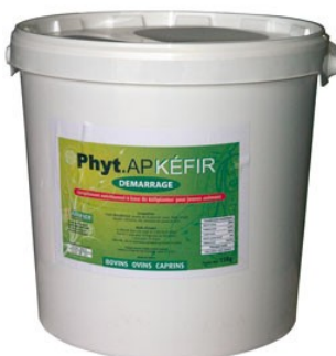
Réf : 0111020