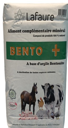
Réf : 0110143