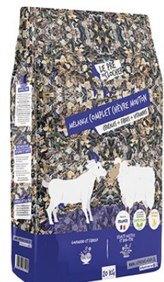
Réf : 0200754