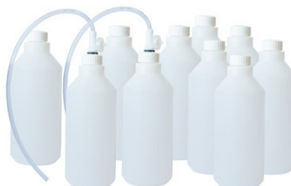
Réf : 0110105