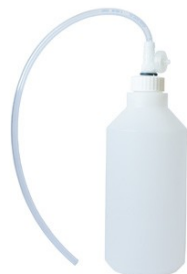
Réf : 0110097