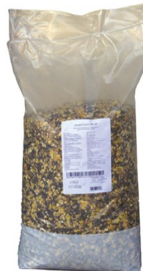
Réf : 0200287