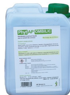
Recharge, réf : 0110108