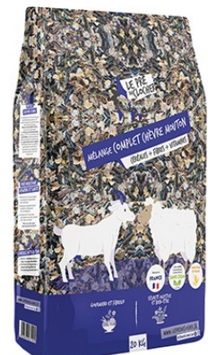
Réf : 0200754