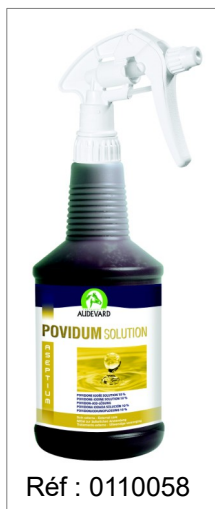
Réf : 0110058