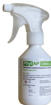
Réf : 0110085