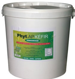
Réf : 0111020