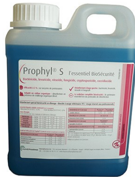
Réf : 0110162