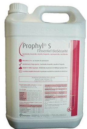
Réf : 0110163