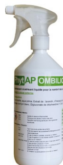
Réf : 0110086