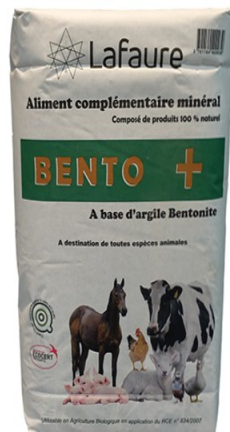
Réf : 0110143