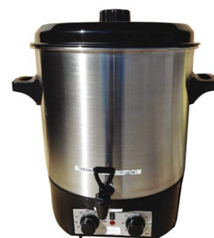
Réf : 0800960