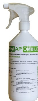
Réf : 0110086