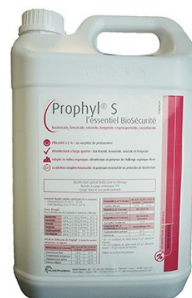
Réf : 0110163