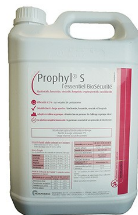
Réf : 0110163