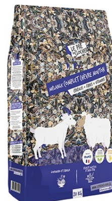
Réf : 0200754