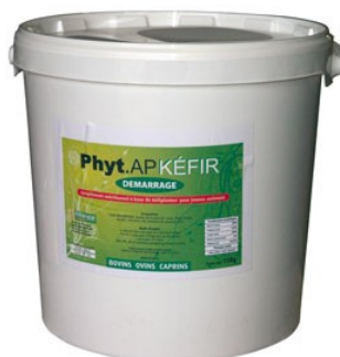
Réf : 0111020