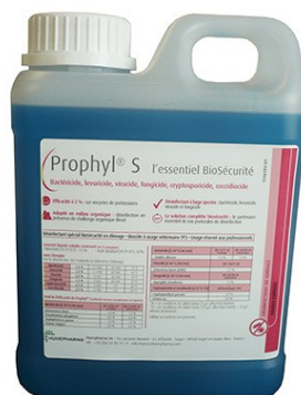
Réf : 0110162