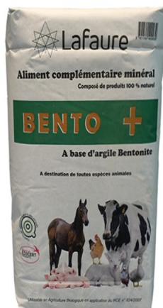
Réf : 0110143