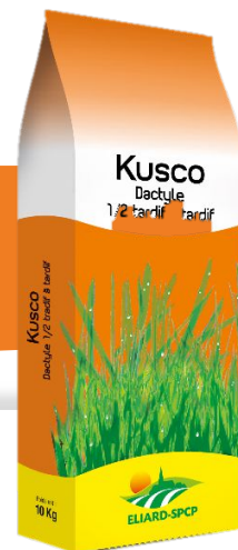
Sac de 10kg